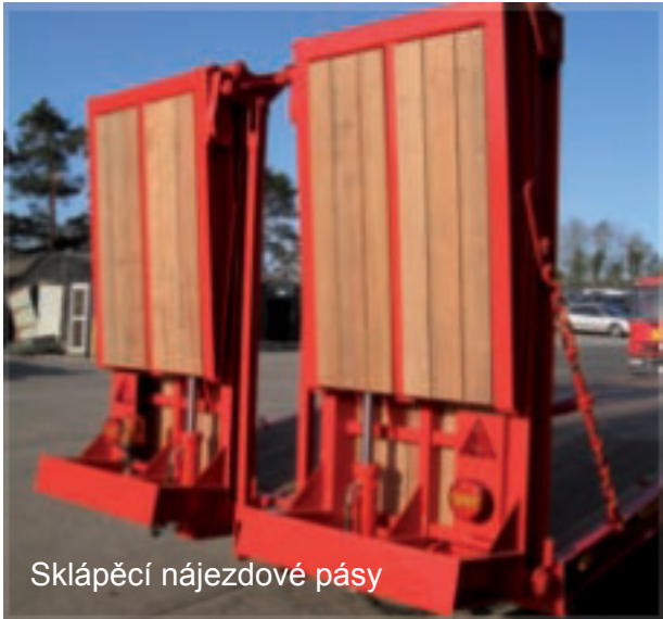
Sklápěcí nájezdové pásy