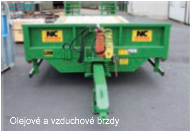
Olejšové a vzduchové brzdy