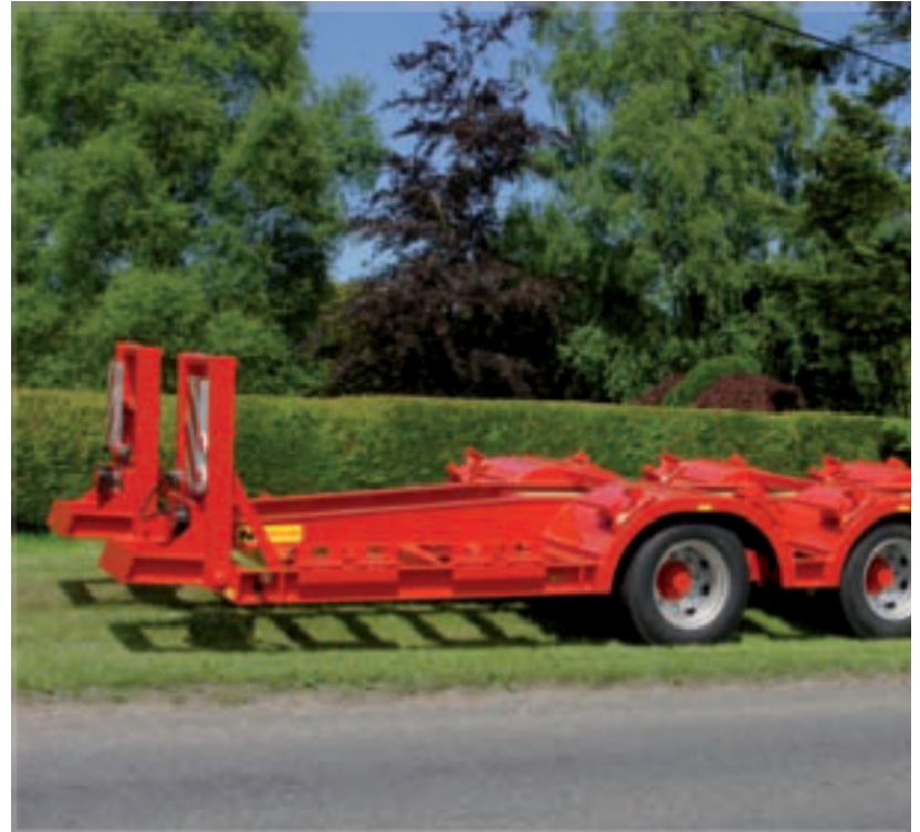
Přívěs pro svoz dřeva