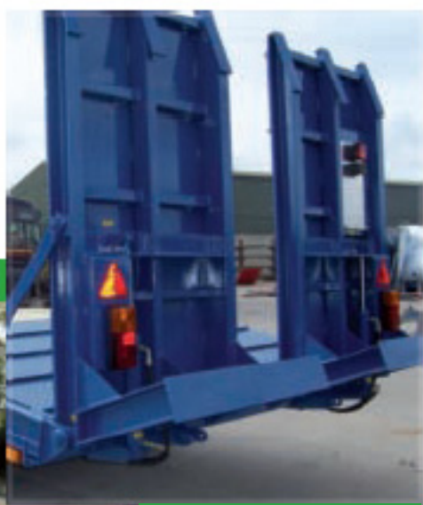
Široké kryté nájezdové pásy